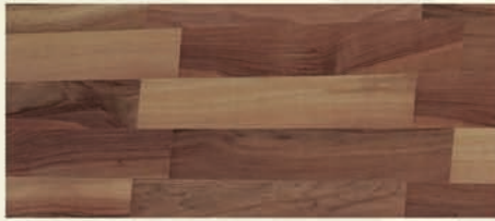
Nuss eur. ged.