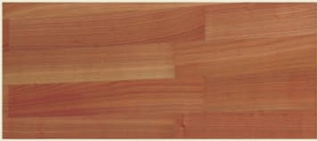
Kirsche eur. ged.