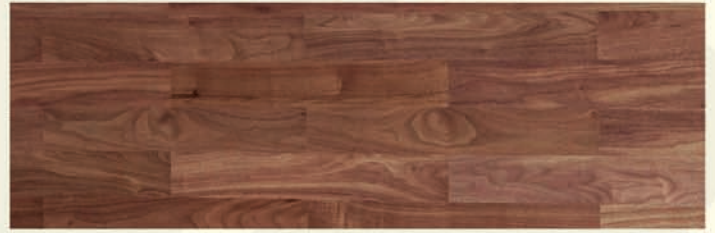
Nuss amk. ged.